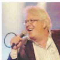
Peppino Di Capri dj sulla web radio del Suor Orsola