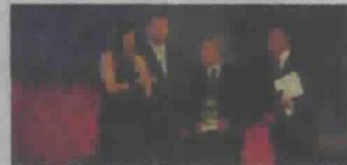
[Premio Ischia 2011]