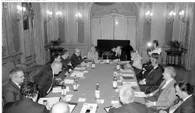
La riunione della giuria del “Premio Ischia” di giornalismo