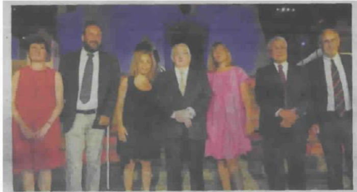
[Il gruppo dei premiati]

La XXXIII edizione del Premio Ischia, e' realizzata sotto l'Alto Patronato della Presidenza della Repubblica, con i patrocini della Presidenza del Consiglio dei Ministri e del Ministero della Cooperazione internazionale e integrazione (Dipartimento della Gioventu'), e con il sostegno della Regione Campania e della Camera di Commercio di Napoli. Nell'edizione di domani le interviste dei protagonisti e soprattutto alcuni simpatici episodi che hanno caratterizzato la serata nel corso della registrazione Rai.