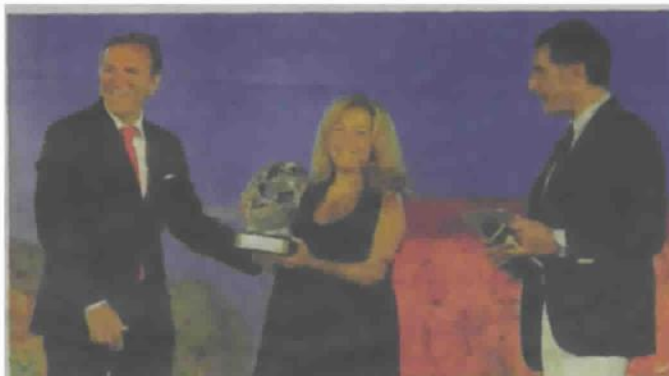
[Donatella Scarnati, giornalista sportiva dell'anno]