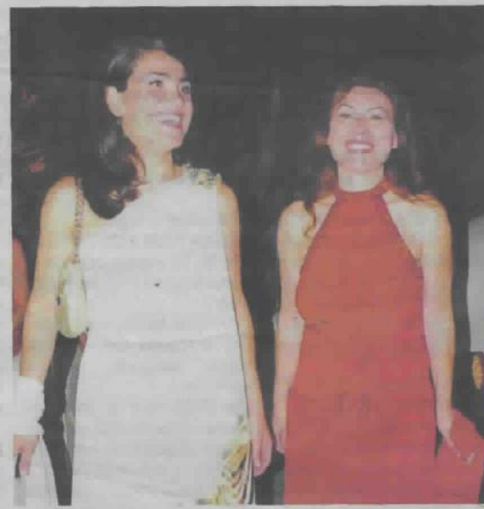
[Impeccabili ed eleganti le first lady della serata]